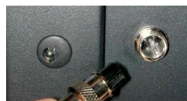
Domotica spanningsloos contact