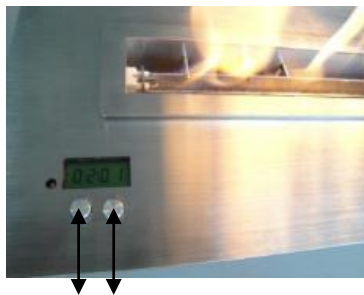
Reservoir openen 2 1 Knop on / off